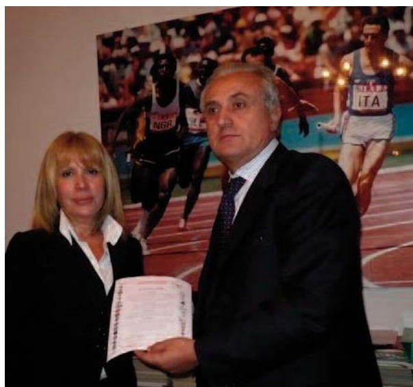
Roma 2008. La giornalista Sabrina Parsi, testimonial della campagna nazionale "Giù le mani dai bambini", presenta a Pietro Mennea il programma di farmacovigilanza contro la somministrazione di psicofarmaci ad oltre 30.000 minori nel nostro Paese.

"Il principio fondamentale su cui si dovrebbe sempre basare l'attività sportiva è l'evoluzione della persona considerata nella sua totalità a cominciare proprio dal suo modo di rapportarsi ed interagire con l'ambiente circostante, ovvero con gli altri esseri umani. In una parola occorre che lo sport concorra alla formazione educativa dell'individuo. Pertanto lo sport - a cominciare da quello olimpico foriero di un altissimo valore esemplare – deve fondarsi su comportamenti ispirati alla lealtà, al rispetto delle regole e dell'avversario, al fair play" (dal libro "Il doping e l'Unione Europea" di Pietro Mennea ).